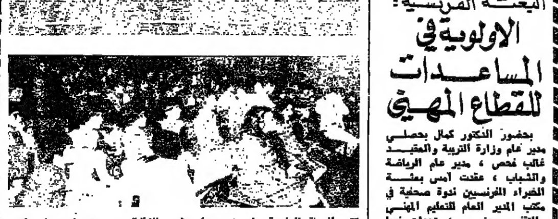
مجلس الجامعة اللبنانية

هل لوزارة العمل والشؤون الاجتماعية كسلطة وصلة دورها في عودة الاجنبيات الى مجلس ادارة الصندوق الوطني للتأمين الاجتماعي والعمل على تنظيمه؟